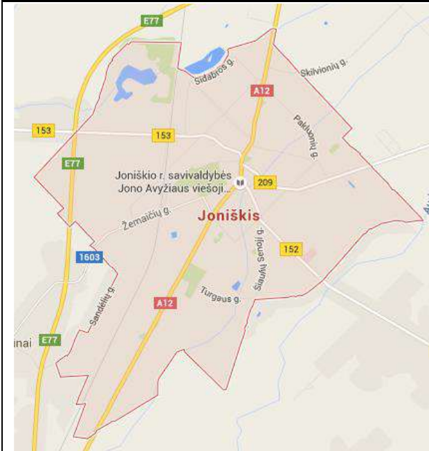
1 pav. Joniškio miesto teritorijos ribos.

Joniškio miestas – Joniškio rajono savivaldybės centras. Miesto teritorija yra nedidelė, užima 895 ha plotą (Joniškio rajono savivaldybės plotas – 115 200 ha).