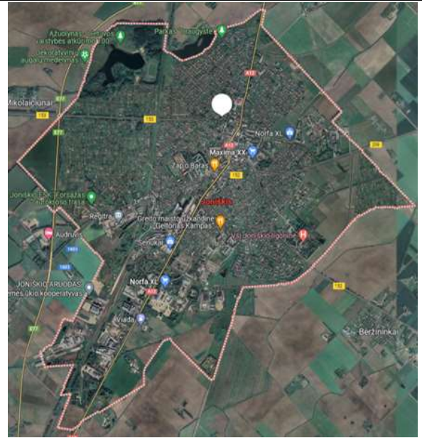
2 pav. Joniškio miesto teritorijos ribos.

Joniškyje išplėtotas žemės ūkio sektorius – žemės ūkio produkcijos gamyba, perdirbimas, prekyba. Žemės ūkio naudmenos užima net 72,2 proc. Joniškio rajono teritorijos. Tai atskleidžia, kad didžioji dalis ekonominių veiklų yra susikoncentravusi rajone ir kaimiškose vietovėse, kas iš dalies turi neigiamą įtaką miesto vystymuisi ir plėtrai.